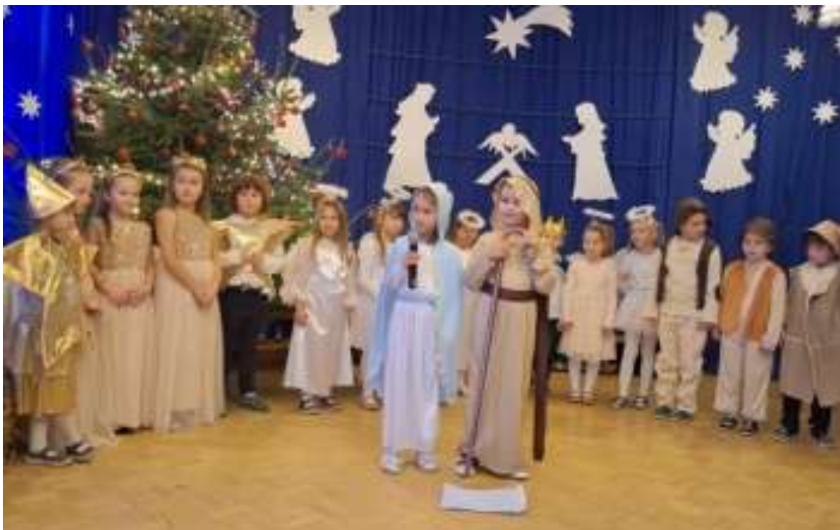
Fot. PM 1