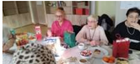
Galeria zdjęć z Mikołajek