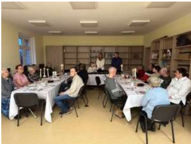
Galeria zdjęć z Wieczery Wigilijnej