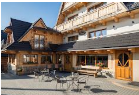
Pensjonat „U Pyrnicki”

Kolonistom sprzyjała pogoda, zatem wypoczynek należał zapewne do udanych, jest co wspominać, a teraz pozostaje tylko czekać do kolejnych wakacji.