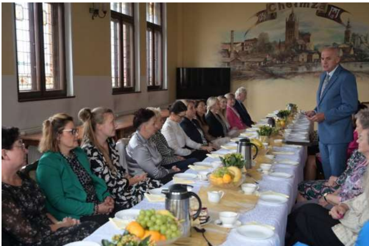
Dzień Edukacji Narodowej w Ratuszu