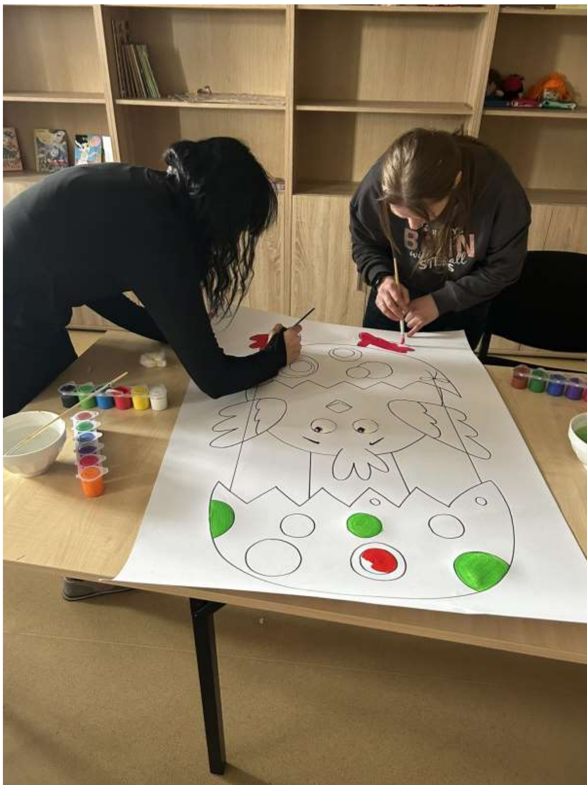
spotkań „Szkoły Rodzica”: