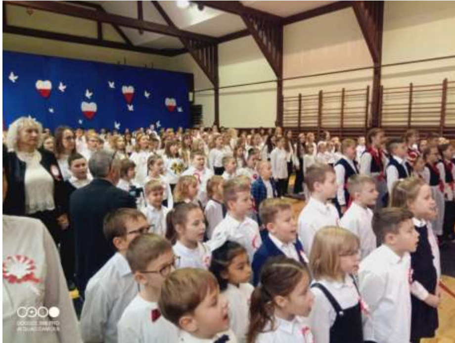
Uczniowie Szkoły Podstawowej nr 3