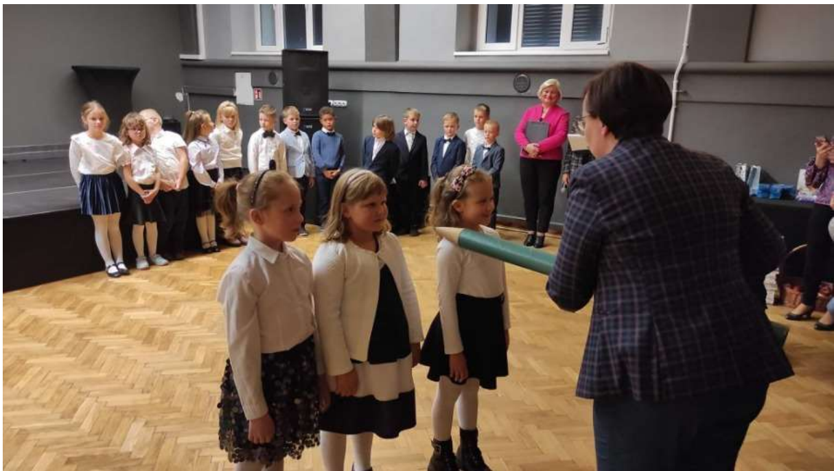
Pasowanie na ucznia SP-5

W październiku pierwszoklasiści szkół podstawowych, w obecności swoich Rodziców, złożyli uroczyste ślubowanie i zostali pasowani na uczniów. To bardzo ważne wydarzenie nie tylko dla dzieci, ale również dla ich rodziców. Zanim pierwszoklasiści zostali przyjęci do grona społeczności szkolnej, musieli przedstawić to, czego się już nauczyli. Dzieci zaprezentowały wiersze i piosenki. Uroczystości przebiegły w miłej i przyjemnej atmosferze.