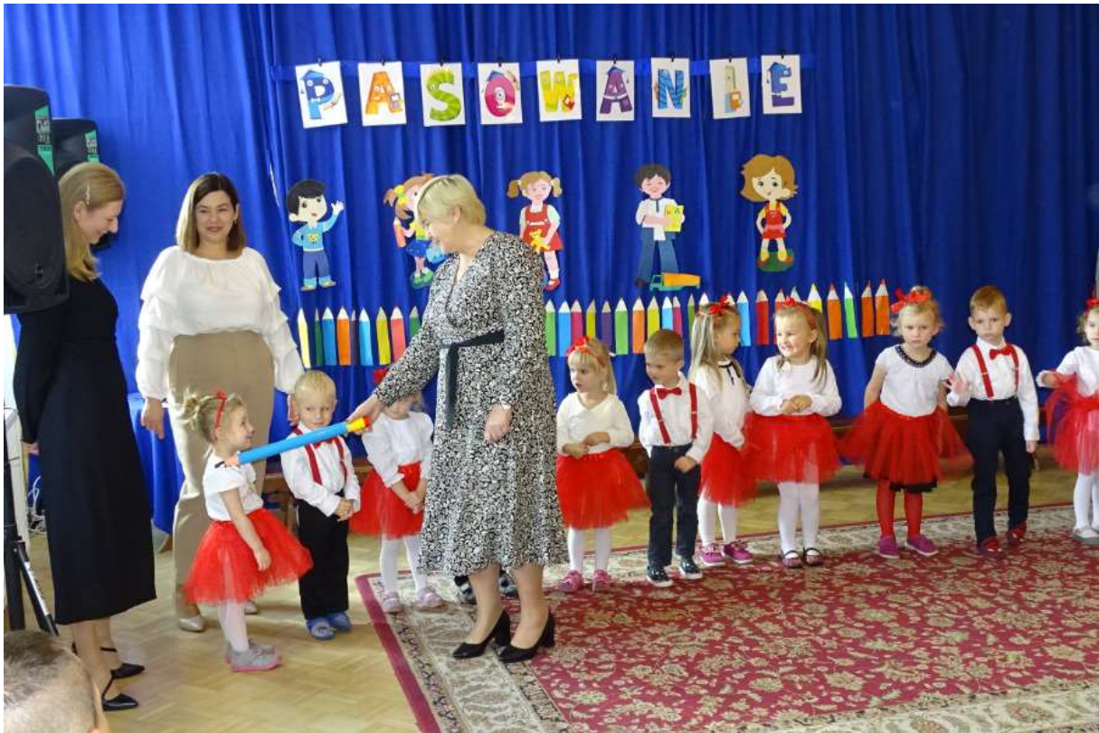
Pasowanie na przedszkolaka P-1