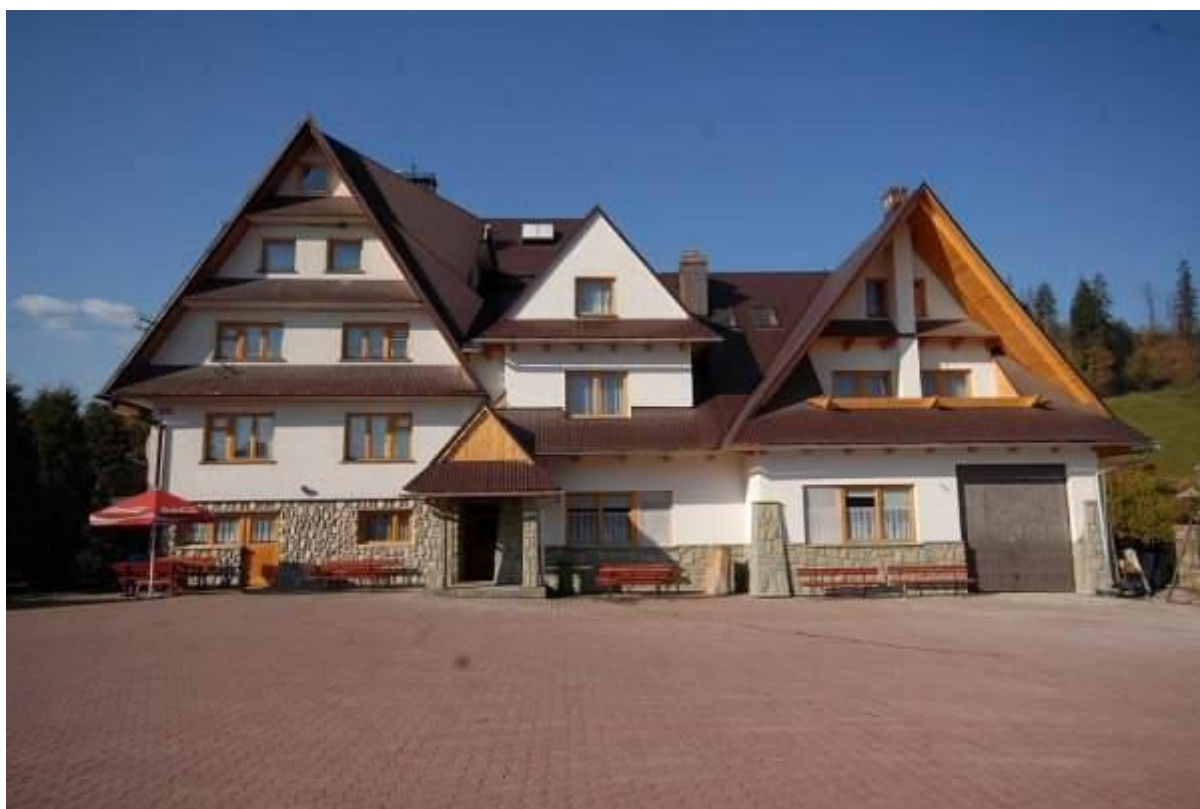
Pensjonat „U Furtoka” w Białym Dunajcu

Kolonistom sprzyjała pogoda, zatem wypoczynek należał zapewne do udanych, zapewne jest co wspominać!