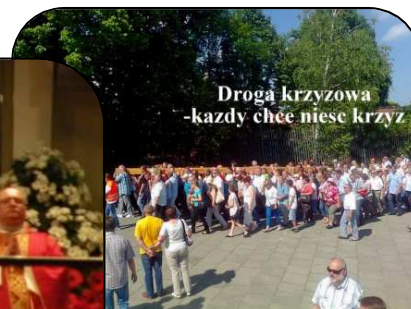
Droga krzyzowa -kazdy chce niesc krzyz