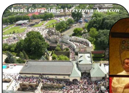
Jasna Góra-droga krzyzowa Aowcow

Wielu uczestników wraca do Chełmży z dużą pokorą i czasami przemienieni duchowo, fizycznie i psychicznie.