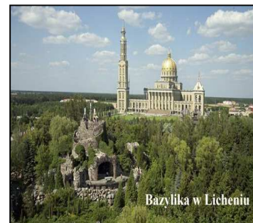
Bazylika w Licheniu

Wychodząc naprzeciw Komisja pomaga chętnym uczestniczyć w wyjazdach na Ogólnopolskie Spotkania Trzeźwościowe w Częstochowie i w Licheniu dofinansowując w części pokrycie kosztów najmu autokaru