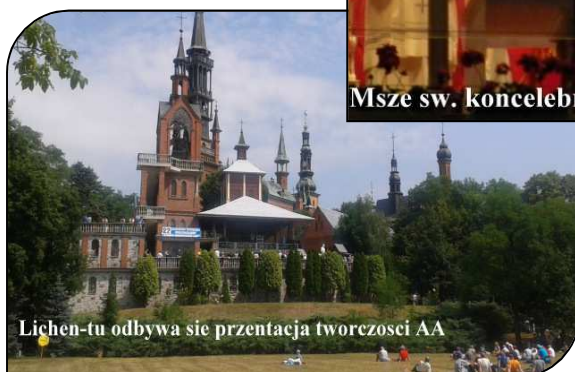
Lichen-tu odbywa sie prezentacja tworcosci AA