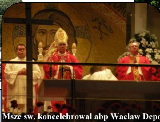
Msze sw. koncelebrowal abp Wacław Depo