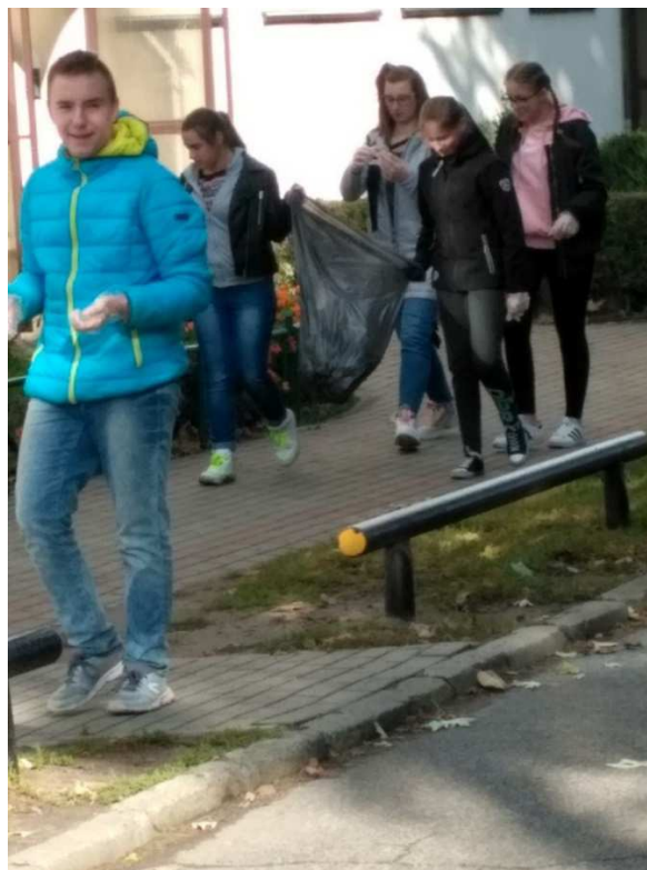
Uczniowie Szkoły Podstawowej nr 3 podczas sprzątania miasta

W piątek 20 września uczniowie starszych klas szkół podstawowych uczestniczyli w akcji sprzątania świata. Uzbrojeni w rękawice i worki zbierali to, co inni pozostawili na chodnikach, ulicach, poboczach i skwerach. Jak co roku, zbierali całkiem sporo odpadów.