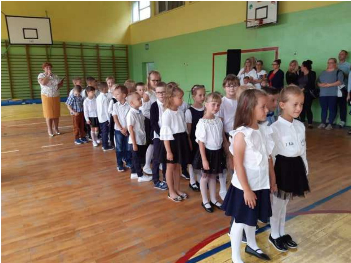
Uroczystość rozpoczęcia roku w Szkole Podstawowej nr 2