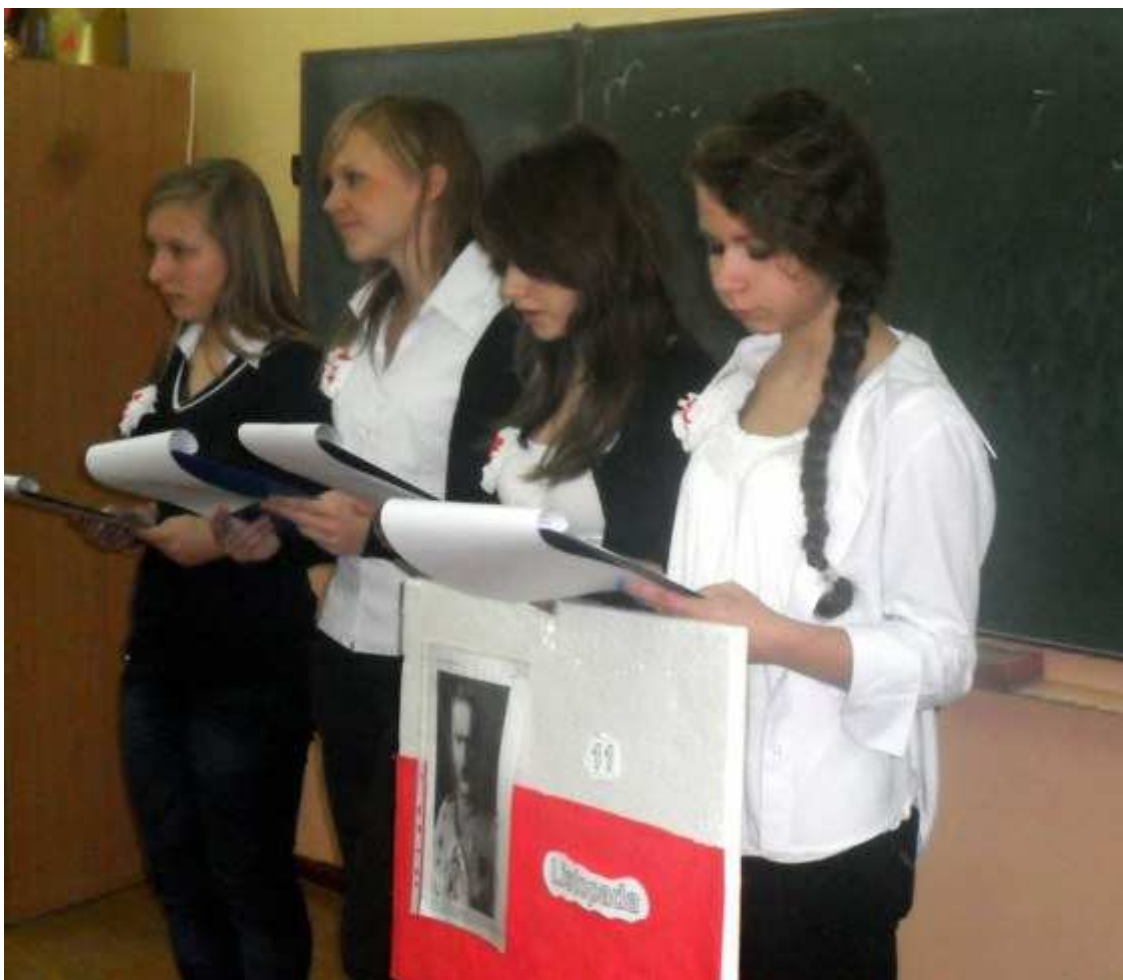
Obchody 11 listopada w Gimnazjum Nr 1 w Chełmży