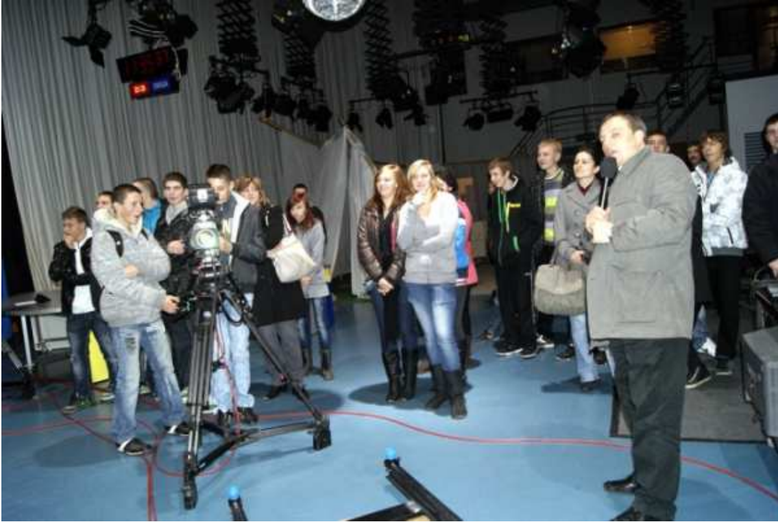
Chełmżyńscy gimnazjaliści w Telewizji TRWAM