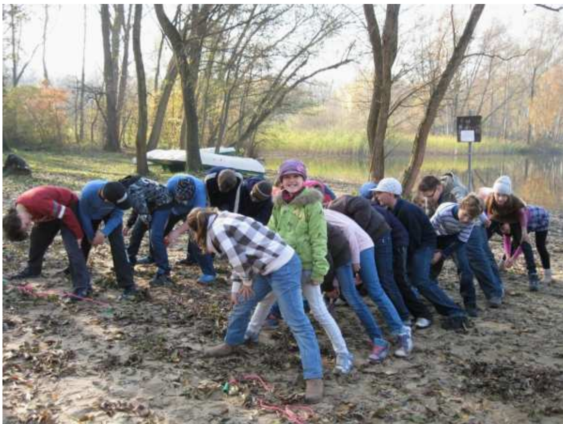
Członkowie SKKT – SP-3