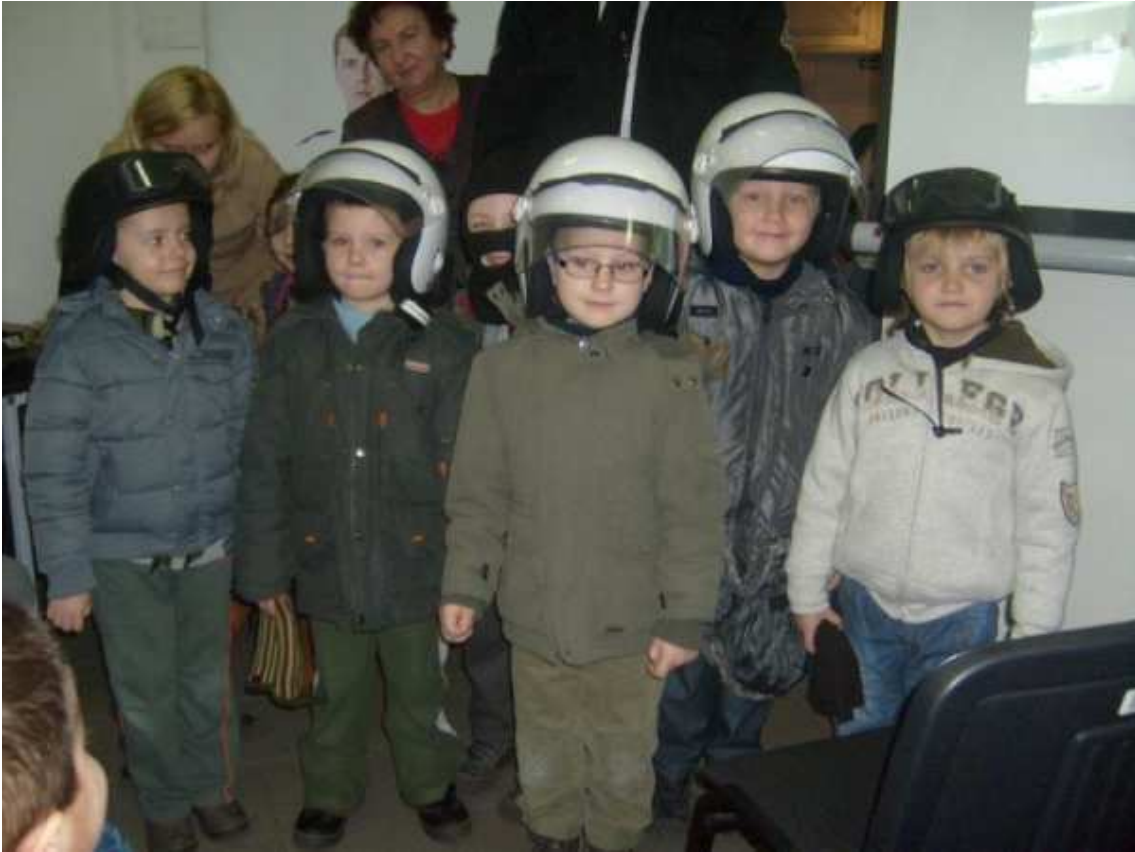
Przedшкоlaki poznają zawody rodziców