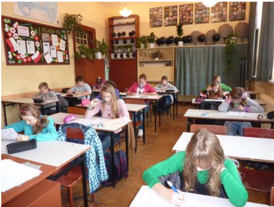
Uczniowie SP-3 podczas testu

z Warszawy. Test, w którym znalazły się pytania z biologii, ekologii, ochrony przyrody, geografii i astronomii należało rozwiązać w ciągu godziny. Jak uczniowie poradzili sobie z konkursem dowiemy się w styczniu, gdy otrzymamy wyniki.