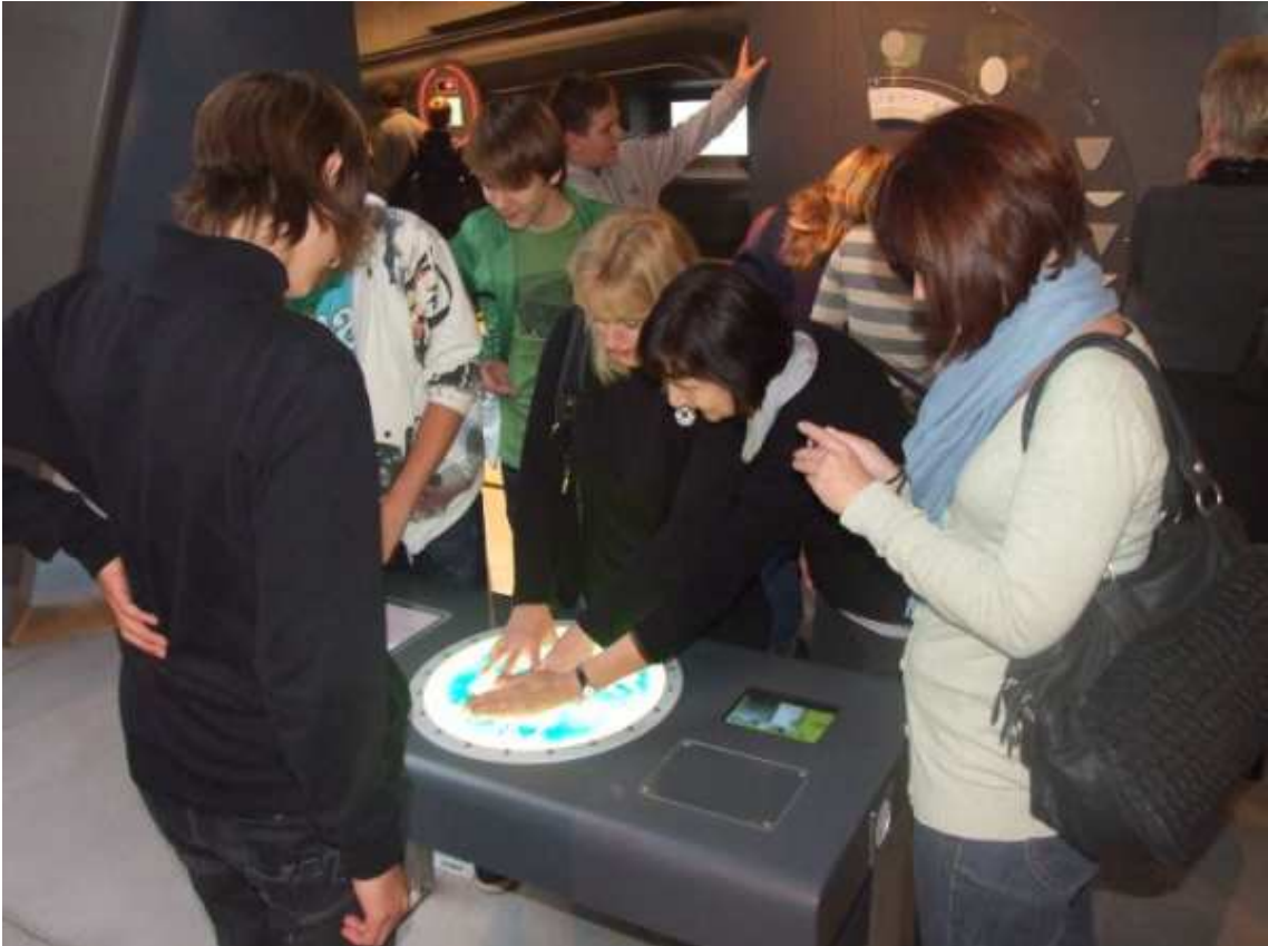
Chełmżyńscy gimnazjaliści w Centrum Nauki Kopernik