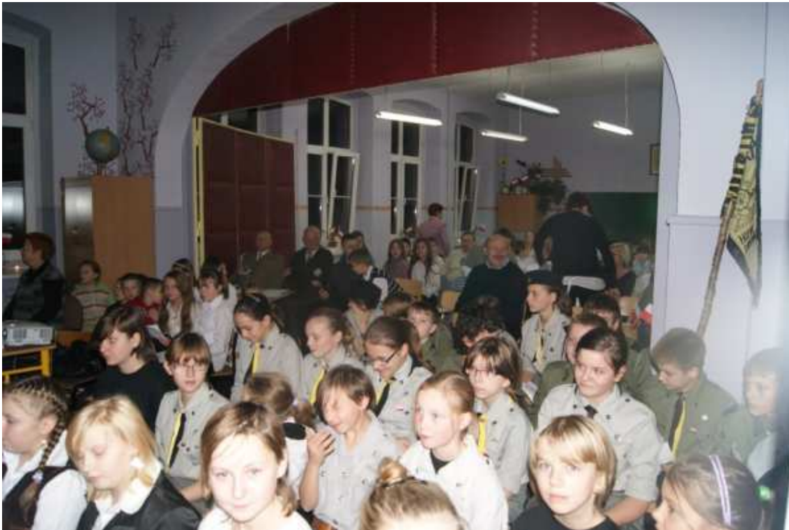
Wieczór Pieśni Patriotycznej w Szkole Podstawowej Nr 2