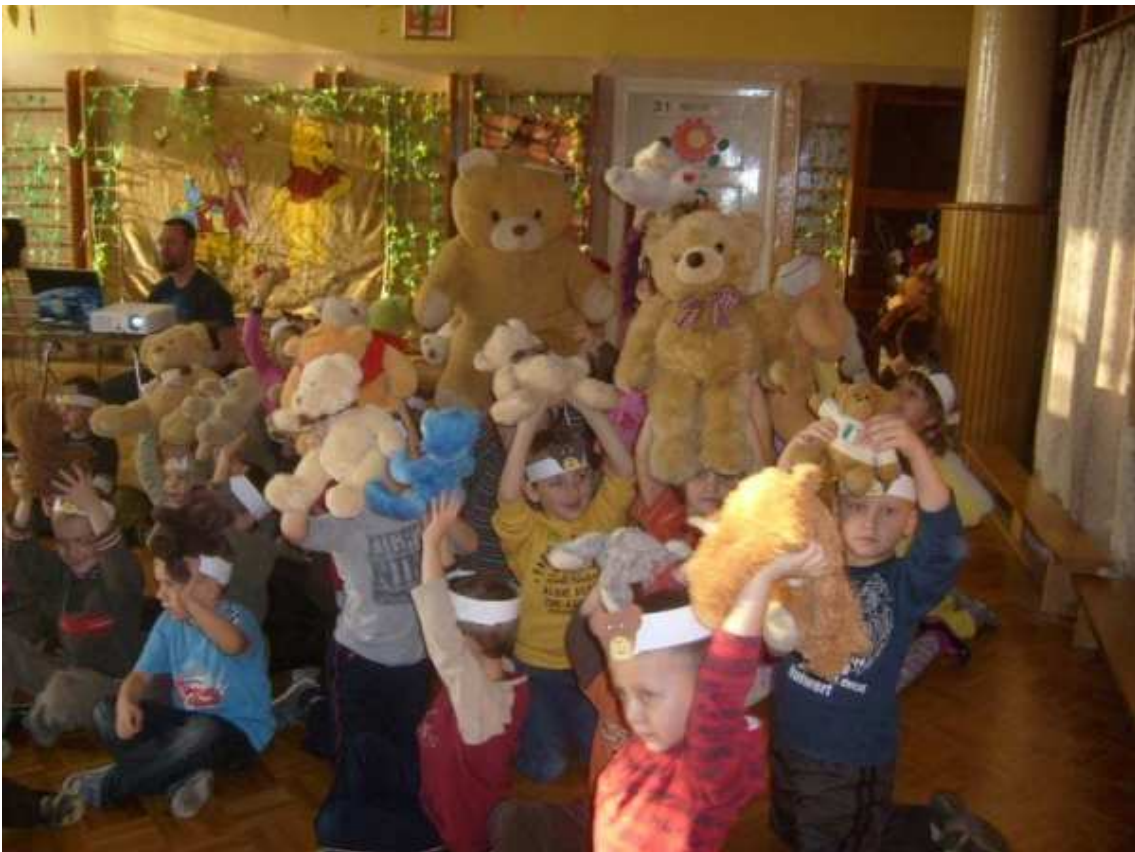
Dzień Pluszowego Misia w Przedszkolu Miejskim Nr 1

z którego dzieci dowiedziały się, gdzie żyją prawdziwe niedźwiedzie, co jedzą, a także gdzie mieszka Kubuś Puchatek, bajkowy bohater. Spotkanie było okazją do wspólnej zabawy tanecznej przy misiowych piosenkach, nie zabrakło także konkursów. W czwartek pozostałe przedszkolaki obchodziły Dzień Pluszowego Misia. Najmłodsze dzieci z tej okazji odwiedził Miś - Gumiś i Pipi, którzy zaprosili dzieci 3- i 4 - letnie do zabawy. Każdy przedszkolak na początku spotkania przedstawił siebie i swojego pluszowego misia. Następnie były tańce, czarowanie cukierków, zgadywanki, nie zabrakło też zabawy „Stary niedźwiedź mocno śpi”. Wszystkie maluchy otrzymały od gości drobne upominki. Starsze dzieci również obchodziły Dzień Pluszowego Misia. Na ten dzień każdy przyniósł do przedszkola pluszowego pupila, były więc konkursy na najmniejszego i największego misia, na najweselszą misiową minkę i wiele innych. Choć każdy dzień w przedszkolu jest ciekawy to Dzień Pluszowego Misia przedszkolaki będą długo pamiętały. Bez wątpienia były to dni pełne wspólnych zabaw w niezwyklej atmosferze.