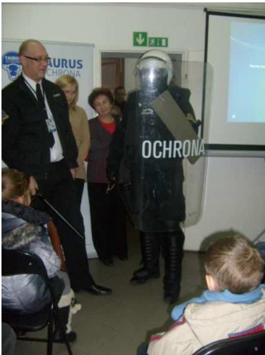
Przedszkolaki poznają zawody rodziców