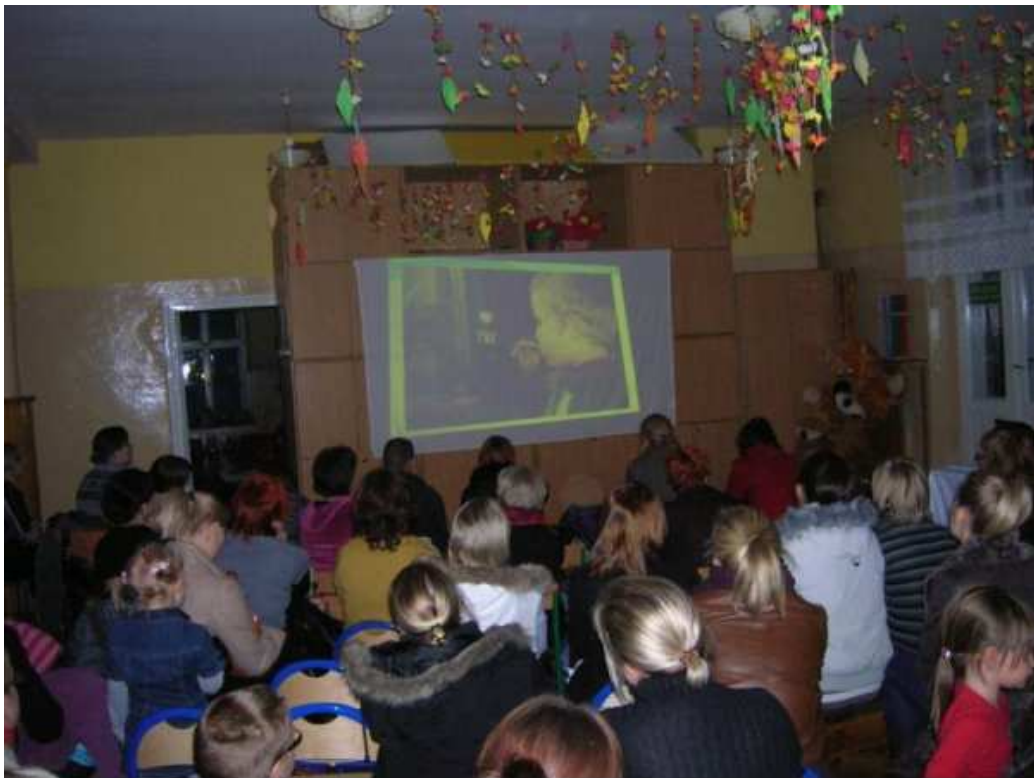
Prezentacja w Przedszkolu Miejskim nr 1