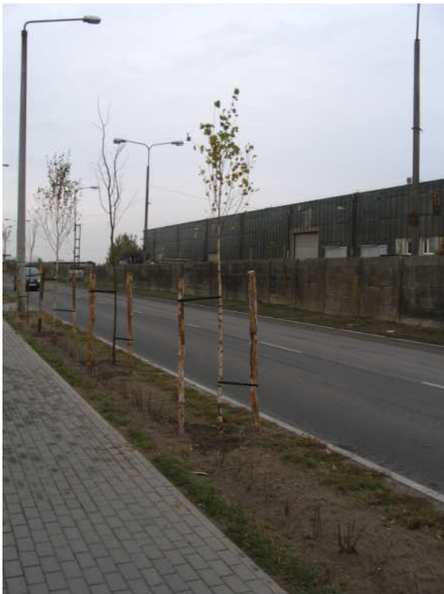
Młode drzewka i krzewy przy ulicy Bydgoskiej